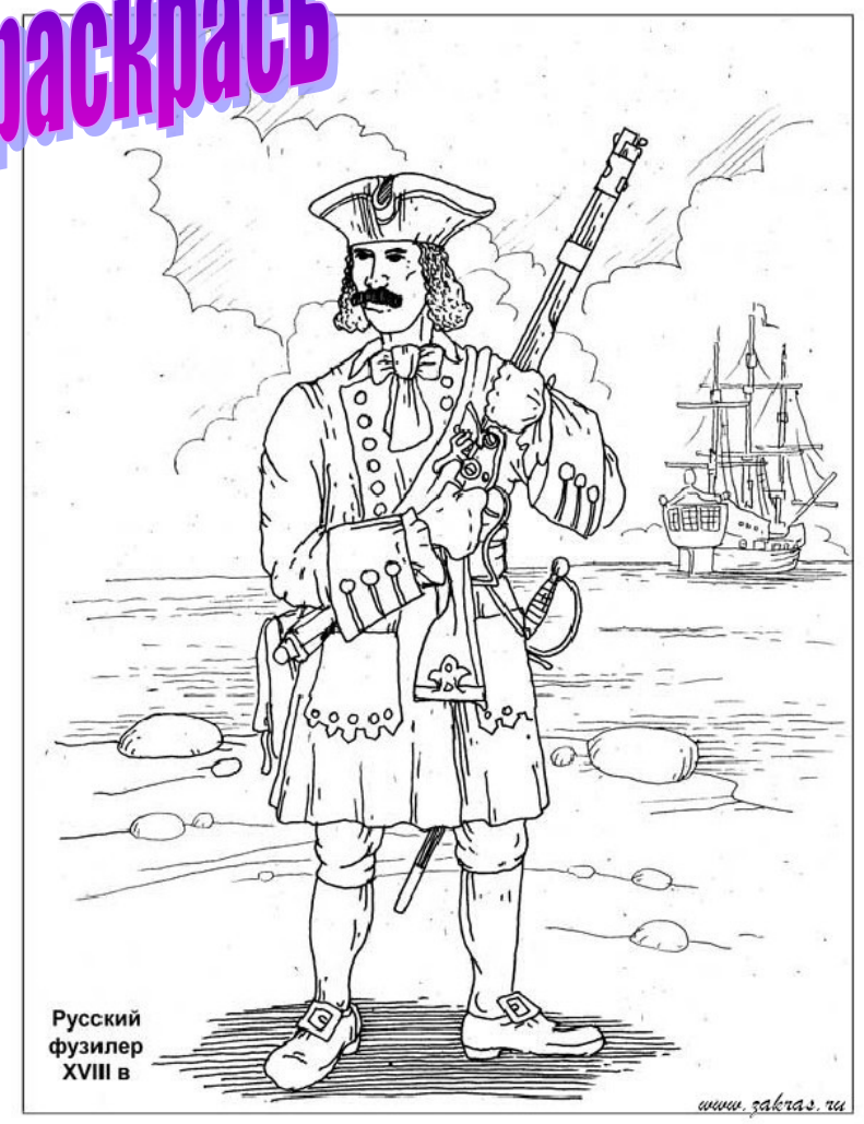
Русский фузилер XVIII в