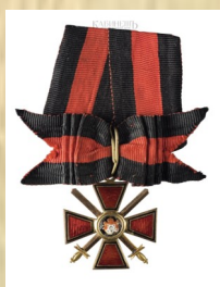
Орден Святого Владимира

Императорский орден Св. равноапостольного князя Владимира установлен в награду подвигов, совершаемых на поприще государственной службы, и в воздаяние трудов, для пользы государству.