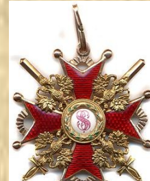
Орден Святого Станислава

Самый распространенный орден и младший по старшинству в иерархии государственных наград, главным образом для отличия чиновников. Орден Св. Станислава имеет три степени. После революции орден не был отменён. Временное правительство сохранило орден Святого Станислава, изменив его внешний вид: