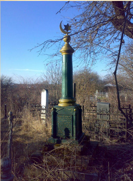
памятник Данилбеку в селении Ногкау

По материалам книги Г.Т.Дзагуровой "Сыны Отечества"