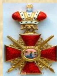
Орден Святой Анны

Императорский орден Св. Анны установлен в награду подвигов, совершаемых на поприще государственной службы. Учреждён в 4 степенях императором Павлом I. Низшая, 4-я степень предназначалась для награждения только за боевые заслуги. По старшинству стоял на ступень ниже ордена Св. Владимира.